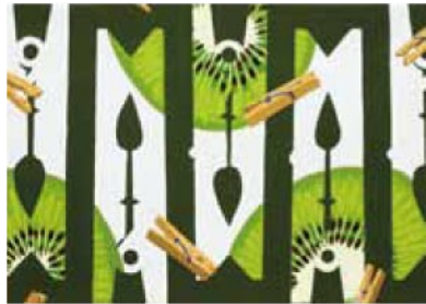
尾道市立大学 美術学科 デザイン専攻 大阪芸術大学 デザイン学科 岡田 萌花 高卒認定