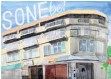
多摩美術大学 生産デザイン学科 プロダクトデザイン専攻 武蔵野美術大学 工芸工業デザイン学科 松浦 幹也 県立大学附属高校卒