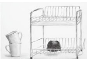
金沢美術工芸大学 デザイン科 環境デザイン専攻 成川 就一 県立加古川西高校卒

JR 曾根駅前校 C 教室にて合格再現展示中 → 7/30(土) 10:00 ~ 19:00