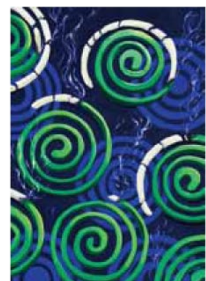
多摩美術大学 グラフィックデザイン学科 多摩美術大学 絵画学科 版画専攻 武蔵野美術大学 視覚伝達デザイン学科 大崎 結花 県立相生高校卒