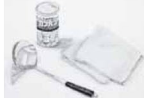
岡山県立大学 デザイン学部 デザイン工学科 三俣 華菜 県立加古川東高校卒