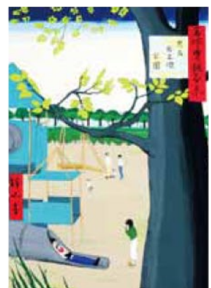
金沢美術工芸大学 デザイン科 製品デザイン専攻 多摩美術大学 生産デザイン学科 プロダクトデザイン専攻 多摩美術大学 環境デザイン学科 武蔵野美術大学 工芸工業デザイン学科 武蔵野美術大学 基礎デザイン学科 山本 恵 県立姫路東高校卒