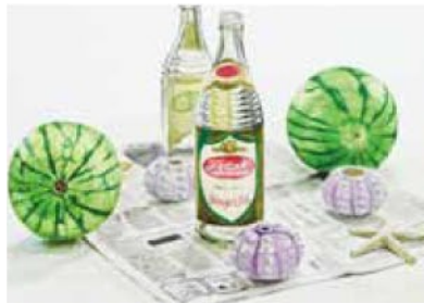
桑沢デザイン研究所 総合デザイン科 プロダクトデザイン専攻 李 信 神戸朝鮮高級学校卒