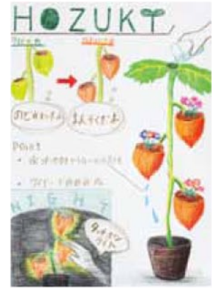
女子美術大学 デザイン工芸学科 プロダクトデザイン専攻 桑沢デザイン研究所 総合デザイン科 プロダクトデザイン専攻 繁田 さくら 県立西脇高校卒