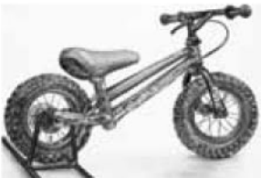
金沢美術工芸大学 デザイン科 製品デザイン専攻 松本 姫佳 県立姫路西高校卒