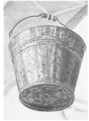
岡山県立大学 デザイン学部 造形デザイン学科 寺内 聖子 県立龍野高校卒